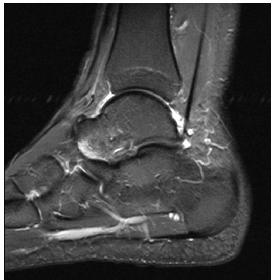
Abbildung 3.1: Kernspintomogramm eines menschlichen Fußes.